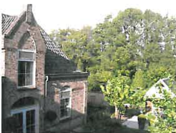
Locatie Raalte (NL)