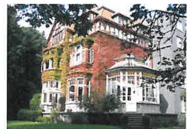
La Manière - Locatie Eeklo (B)