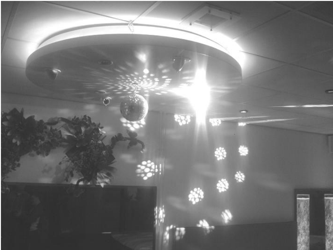
Plaatje 5.9: "Snoezelruimte"

In Nederland wordt het snoezelen op veel locaties en manieren aangeboden. Er is echter nog geen onderzoek gedaan naar de daadwerkelijke effecten.